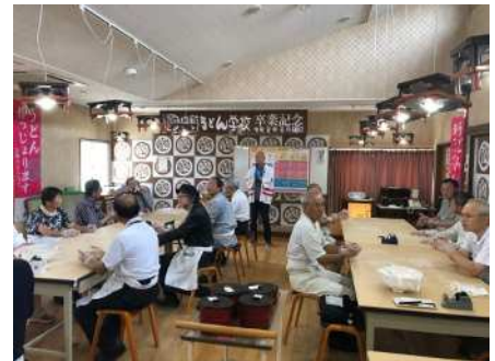
中野うどん学校でうどん打ち体験