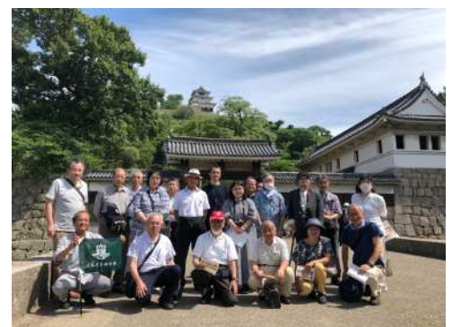
丸亀城大手門で記念写真