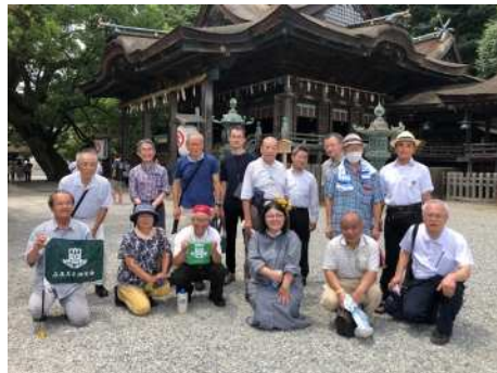
785段の石段を登り本宮参拝