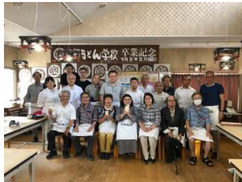
中野うどん学校、無事卒業