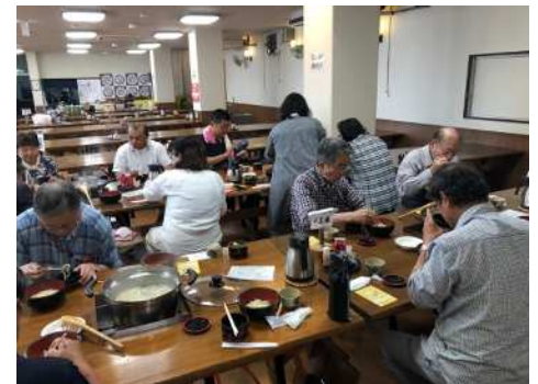
自分で打ったうどんで昼食