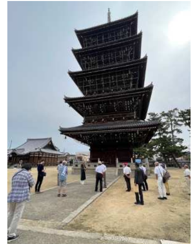
国内で三番目に高い五重塔